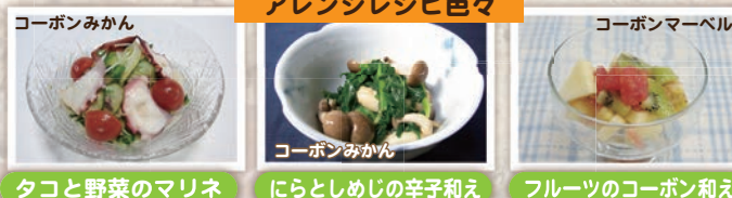
コーボンみかん タコと野菜のマリネ コーボンマーベル にらとしめじの辛子和え フルーツのコーボン和え